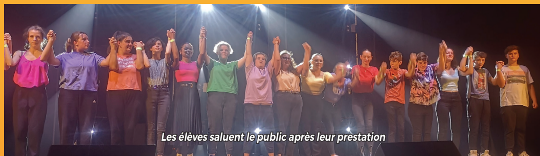
Les élèves saluent le public après leur prestation