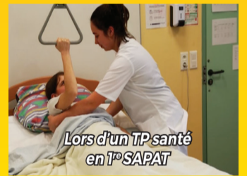
Lors d'un TP santé en 1 er SAPAT