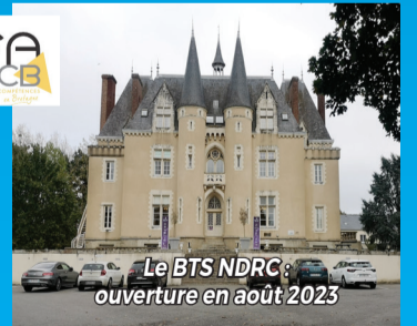
Le BTS NRDC : ouverture en août 2023