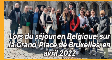
Lors du séjour en Belgique, sur la Grand-Place de Bruxelles en avril 2022

Tout commence en première année avec un stage hebdomadaire, le vendredi, ce qui permet d'alléger une semaine théorique de cours. Place ensuite aux deux stages de quinze jours chez des partenaires de Bain-de-Bretagne : primeurs, fleuriste, vêtements, grandes surfaces, multi-accueil, hôpital... L'immersion professionnelle se poursuit la seconde année avec trois périodes de stages de deux semaines dont une à Namur en Belgique.