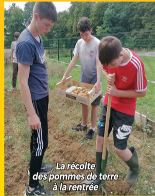
La récolte des pommes de terre à la rentrée

Dès la quatrième, les élèves participent à trois semaines de stage dans des entreprises de leur choix près de leur domicile : artisans, crèches, commerces... En troisième, les jeunes bénéficient d'une heure d'accompagnement personnalisé par semaine autour de l'orientation, avant de suivre six semaines de stage obligatoires. Une semaine est ensuite réservée pour confirmer un apprentissage.